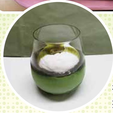
敬老会おやつ 抹茶ムース