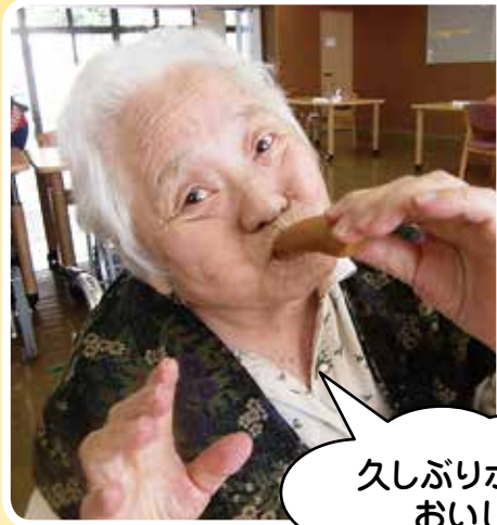
久しぶりポップ焼き、 おいしーい♪