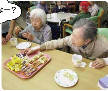
おやつバイキング