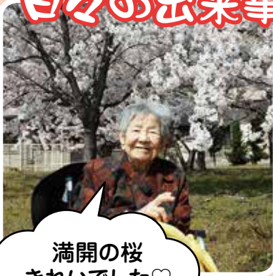
満開の桜 きれいでした♡