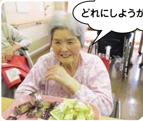
どれにしようかなー？