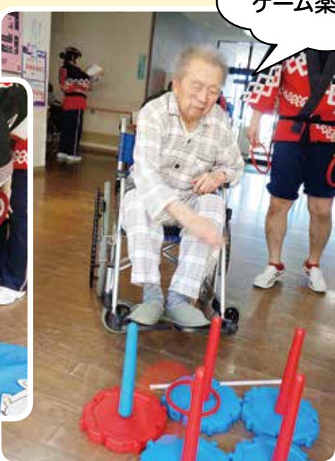
ゲーム楽しいなあ