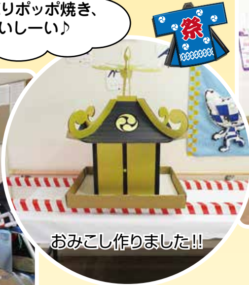
おみこし作りました!!