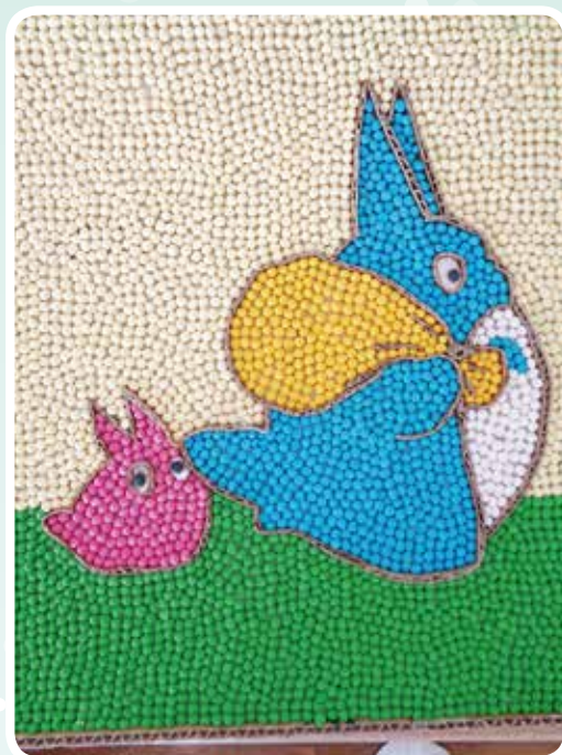
夏の風物詩「となりのトトロ」