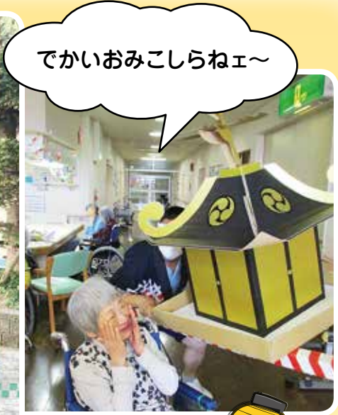
でかいおみこしらねエ〜