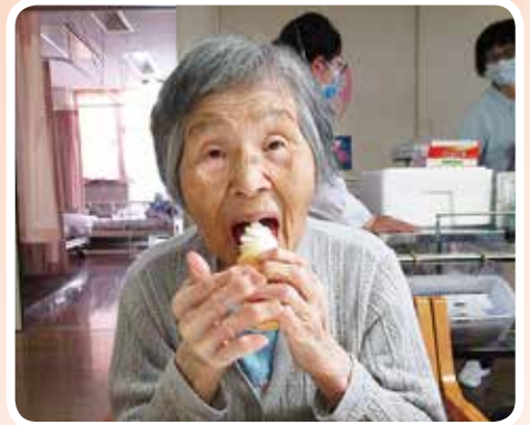
アイスクリームバイキング