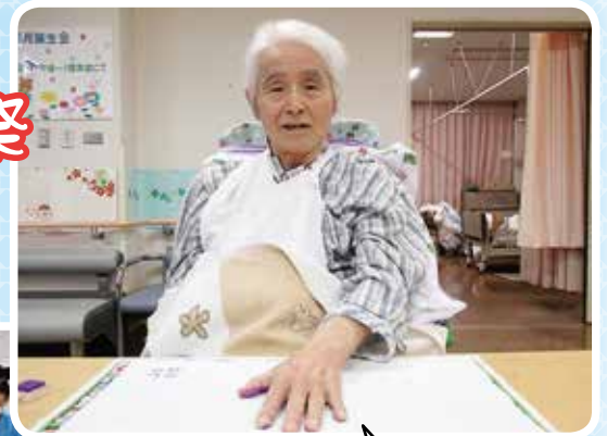
作品製作中(手形をペタン)