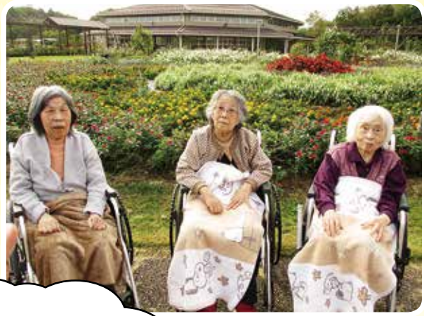
青空の下でハイチーズ!