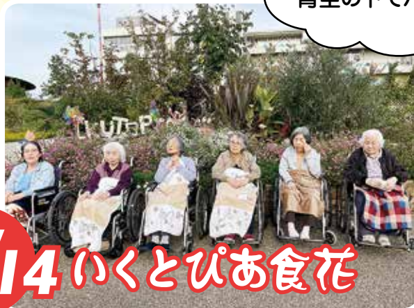
R4 10/14 いくとぴあ食花