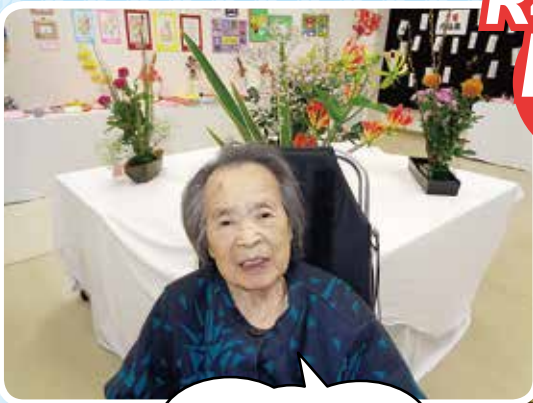
力作がそろいました