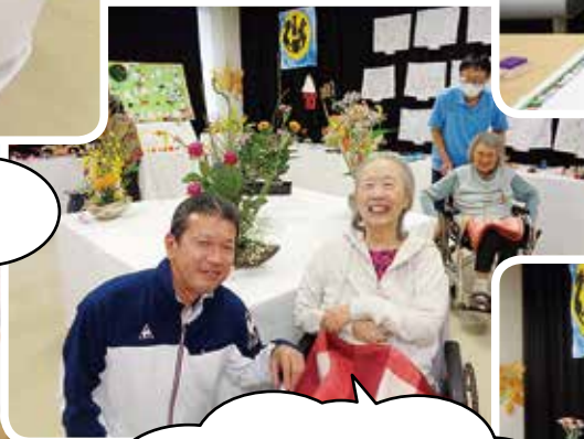
施設長とツーショット!!