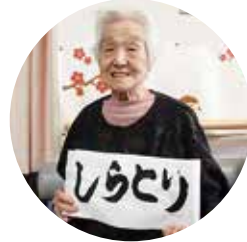
「しらとり」題字 高橋 貢様

特別養護老人ホーム デイサービス ショートステイ 居宅介護支援センター 小規模多機能ケアホーム 小新しらとりの家 みのりこどもえん