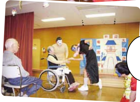
みんなが知ってる 浦島太郎さん、 白鳥の里では こうなりました