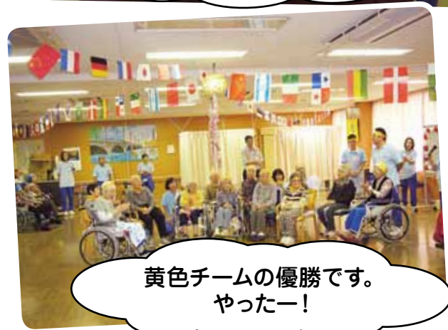
黄色チームの優勝です。 やったー!