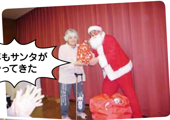
今年もサンタが やってきた