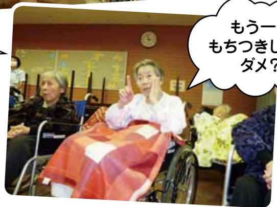
もう一回 もちつきしよ。 ダメ?