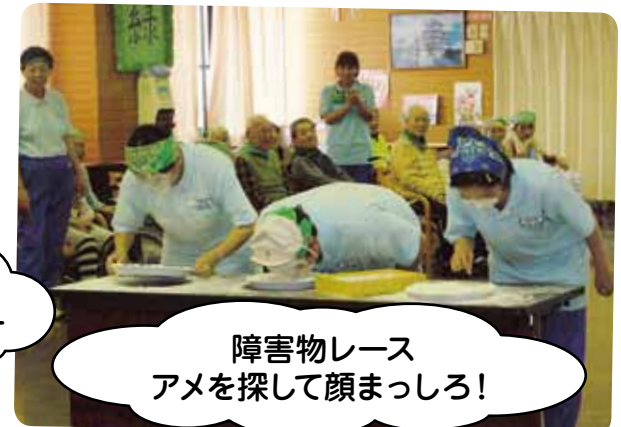
障害物レース アメを探して顔まっしろ!