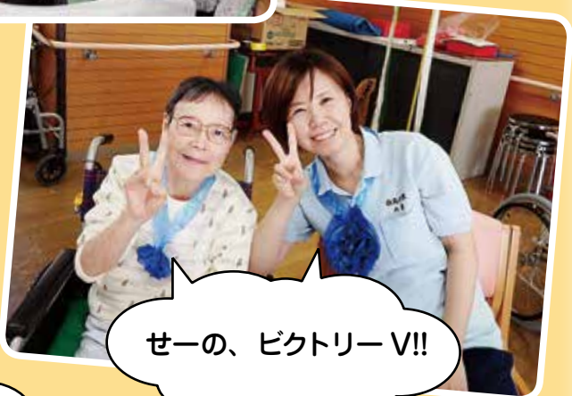
せーの、ピクトリーV!!