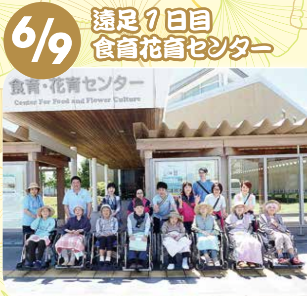
6/9 遠足1日目 食育花育センター