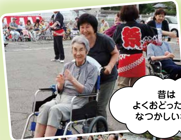
昔はよくおどったな～なつかしいな～