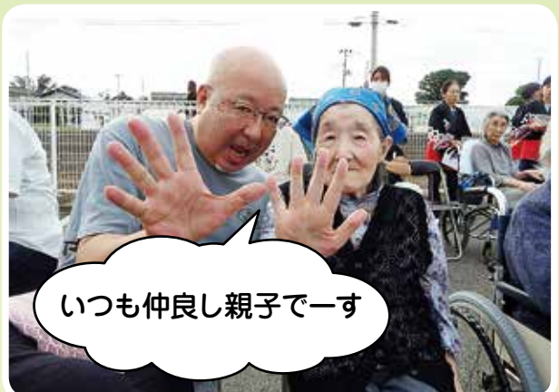
いつも仲良し親子で一す