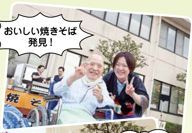
おいしい焼きそば発見!