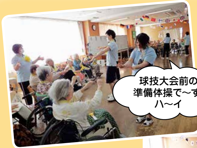
球技大会前の 準備体操で～す。 ハ～イ