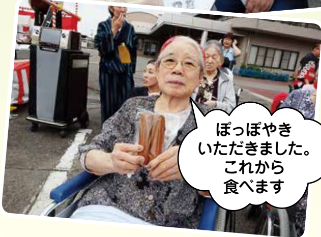
ぽっぽやきいただきました。これから食べます