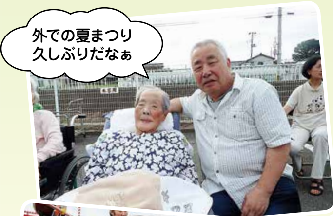
外での夏まつり久しぶりだなあ